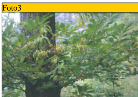
Deperimento della vegetazione a carico di una branca

La sintomatologia si accentua nel corso della stagione, perdurando fino all'epoca della maturazione dei frutti; le piante colpite risultano meno produttive