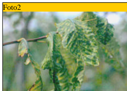
Arricciamento della lamina fogliare, accompagnato dalla presenza di macule necrotiche irregolari localizzate sui margini

La sintomatologia si accentua nel corso della stagione, perdurando fino all'epoca della maturazione dei frutti; le piante colpite risultano meno produttive